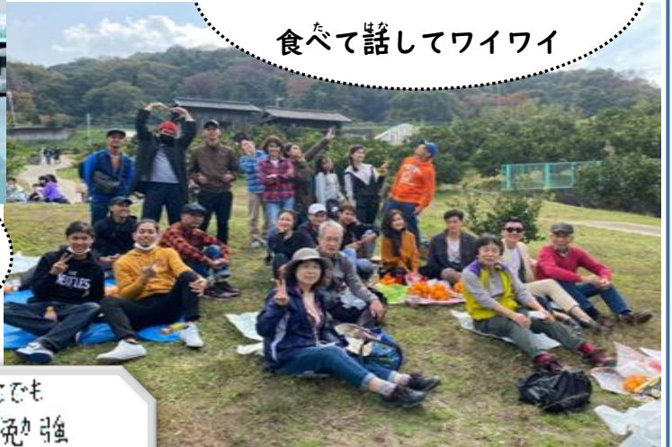
ミカン狩り、 食べて話してワイワイ