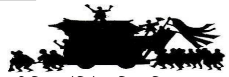
किशिवादा तेन्जिगु मन्दिर जिल्ला २२